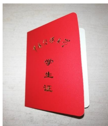
/攝於中國傳媒大學

赴陸交換的這趟旅程，特別感謝靜宜大學提供了這難能可貴的機會，讓我有機會在大學生涯以交換生身份體驗及擴展自身的國際視野。同時，也藉著這份交換的心得，讓自己能夠以當事人和局外者的不同角度回顧和記錄這交換旅程所發生、學習與相遇的人事物。