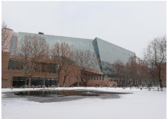
/中國傳媒大學一雪