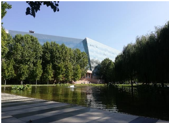
/中國傳媒大學一夏

最後，感謝靜宜大學，國際處老師還有家人給我機會參與這趟交換旅程，讓我大學生涯中增添一份特別的體驗與回憶。感恩在交換期間遇見的所有人事物，讓我可以從他們身上學習與自我進步。這也是我這趟交換旅程最珍貴的收穫。即使交換回國後，我也會持續增進自己以及勇於嘗試任何的機會，從中發掘自己更多的可能性，並且會把交換期間的所學加以運用在未來的道路。