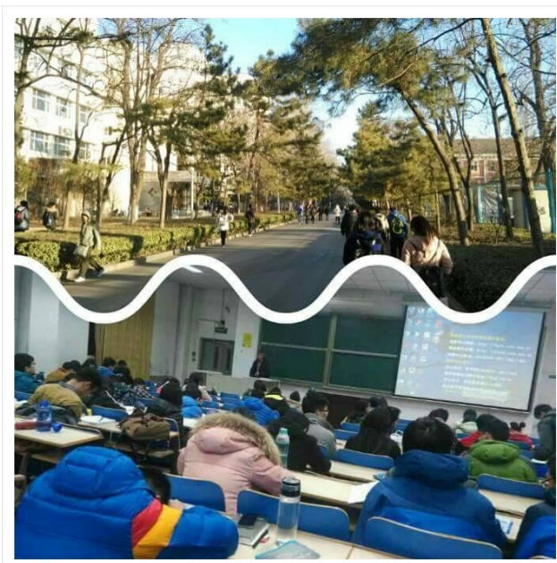
認真的等老師來上課